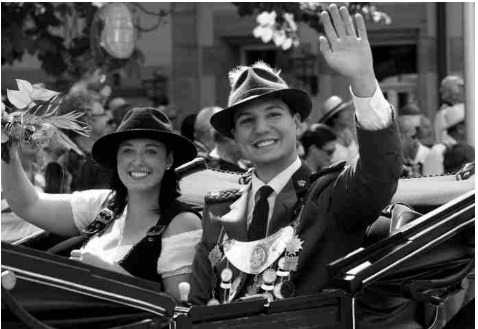
Beim Einmarsch am Marktplatz

Am Kirchweihfestzug der Stadt Zirndorf war der SSV Wintersdorf mit einem Gespann und der Fußgruppe, sowie der Schützenjugend beteiligt. Heuer konnte die königskutsche wieder besetzt werden und das Königschützenpaar gab ein sprichwörtlich hervorragendes Bild ab, dass es sogar in die Zeitungen schaffte, schaut auf die folgenden Bilder. Wir gaben ein sehr ansehnliches Gesamtbild ab, was auch der – naja - relativ guten Beteiligung zu verdanken war. Das Wetter: wie fast immer - warm bis heiß und durstfördernd. Das anschließende Treffen in der Mühle war obligatorisch. Vielen Dank an alle Teilnehmer.