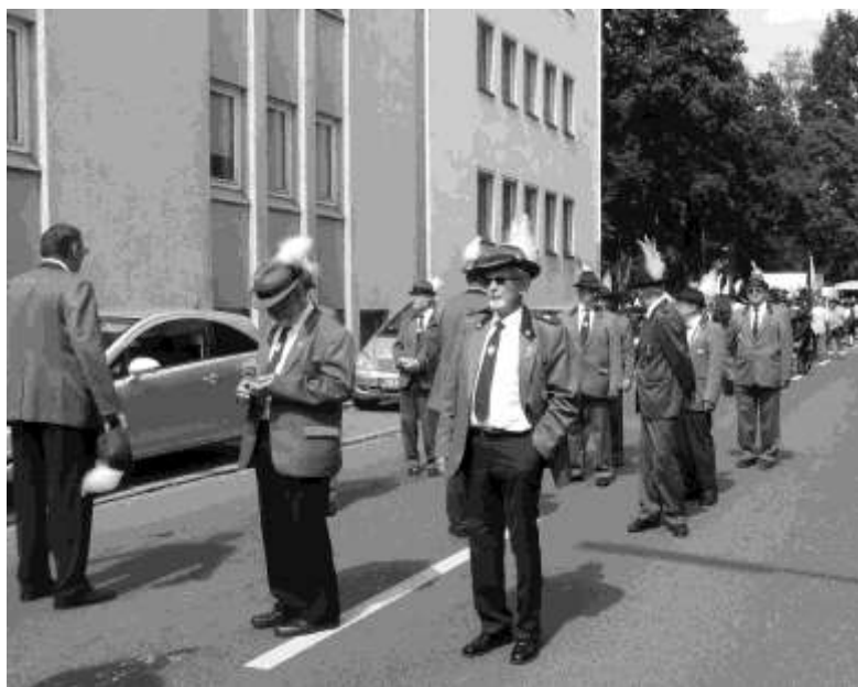
Kurz vor dem Start um 14 Uhr