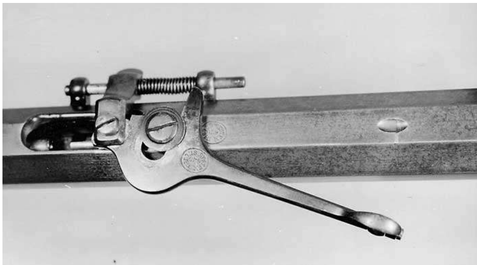
Historischer Zimmerstutzen mit Stiegele System