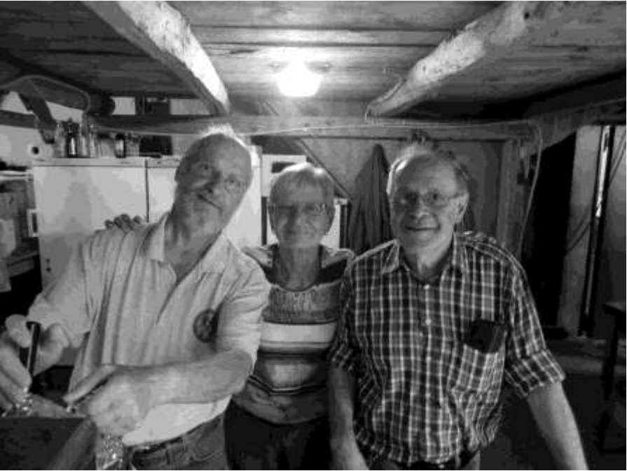
Ganz wichtig: Der Ausschank!