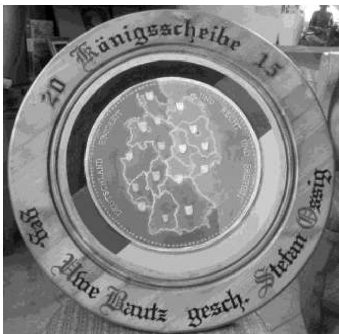
Die Königscheibe 2015