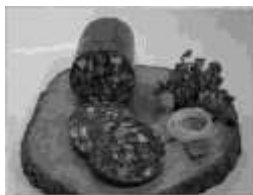
Der gute Presssack

Auch hier wiederum ein herzliches Dankeschön an alle Helfer und Spender, die dieses Schießen unterstützt haben. An dieser Stelle wieder explizit an die Helfer in der Auswertung, das ist beim Presssackschießen richtig viel Arbeit, die bis spät in den Abend hinein im Auswerteraum sitzen müssen.