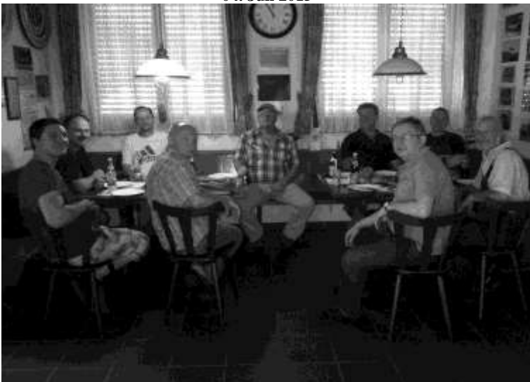
Brotzeit nach getaner Arbeit ist Pflicht, danke an alle.