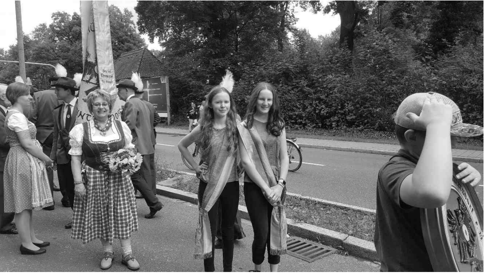
Vor dem Abmarsch

Kritische Blicke in jede Richtung – wir alles klappen?