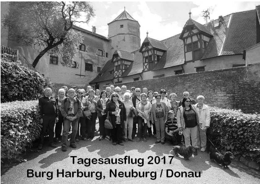
Gruppenbild vor der Burganlage Harburg

Von Harburg ging es nach Büchenbach in die Gaststätte Heyder zum Abendessen. Ein wirklich gelungener Tag, unser Dank gilt auch dieses Jahr erneut unserem Vergnügungsausschuss.