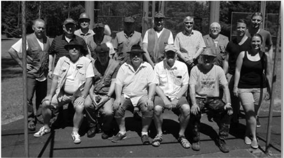
Die Mannschaften beim Freundschaftsschießen bei der ASG Zirndorf