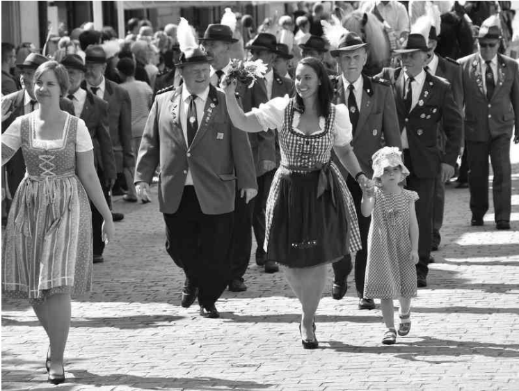
Einlauf vor der Tribüne der Stadträte und des Bürgermeisters